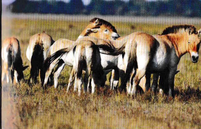
Przevalszkij-vadlovak a Hortobágyi Nemzeti Parkban.

Mongóliában járva a vidéket hófödte hegycsúcsok, dombok, erdős, sziklás hegyek, északon fenyvesek, majd dél felé haladva erdős sztyeppék, sztyeppék, félsivatagok és sivatagok tárulnak szemünk elé. A hatalmas országnak négyezer folyója, háromezer kisebb-nagyobb tava van, igen gazdag ásványi kincsekben. Éghajlata erősen kontinentális, kemény és hideg telekkel, napközben forró, éjjel hűvös nyarakkal. A tavasz és az ősz rövid. A flóra és fauna igen gazdag. A tajga és a magas hegyek lakói többek között a medve, a prémes