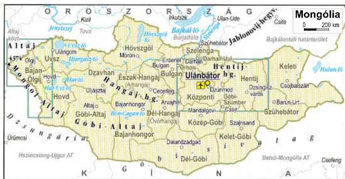
Mongólia adminisztrációs térképe

A mintegy másfél milliárd négyzetkilométernyi területű Mongólia Legbelsőbb Ázsiában található. Északon Oroszország, délen Kína határolja, tengerpartja nincsen. Területének nagyobb része füves pusztaság, délen a Góbi sivatag, északon hegyek és fenyőerdők határolják. Lakosainak száma napjainkban több mint hárommillió, ebből egymillióan élnek a fővárosban, Ulánbátorban. A vidék népsűrűsége meglehetősen csekély, néhány ember négyzetkilométerenként.