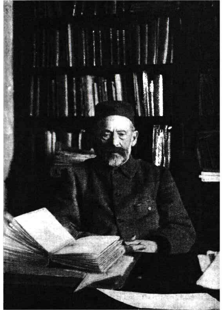
Vámbéry Ármin magyar orientalista, egyetemi tanár, akadémikus (1832–1913).

Abban az időben a Magyar Nemzeti Múzeum könyvtárában dolgoztam. A Móra Ferenc Könyvkiadónál akkoriban jelent meg a történelmi regényem Spártáról. Ennek a könyvnek a honoráriumából az IBUSZ Utazási Irodával turistaként elutaztam az Üzbeg Szovjet Köztársaságba. Ez volt az első ázsiai utam. Taskenti orosz idegenvezetőnk rajongott a magyarságért és Magyarországért. Ő hívta fel a figyelmemet arra, hogy milyen szép feladat lenne végigjárni a nagy Kelet-kutató, Vámbéry Ármin útját a Kara Kum sivatagon keresztül, Khívába, Bokharába és Szamarkandba. Megbeszéltük, hogy megpróbálunk megszervezni egy ilyen utat. Nem volt arról tudomásom, hogy akkoriban ez teljesen lehetetlen. A sivatagi út közönséges halandók számára a szovjet időkben tiltott volt, és elképzelhető, hogy még ma is az. Mégis fontos volt ez a terv: elindított későbbi ázsiai útjaim felé.