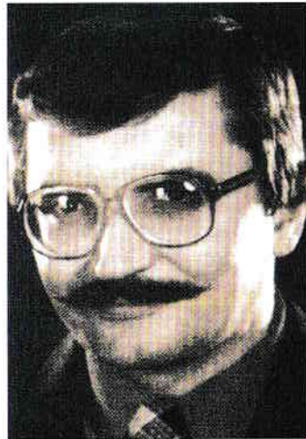
Mándoky Kongur István nyelvész, turkológus (1944–1992)

Mándoky Kongur István az 1980-as években Budapest 8. kerületében, egy szükséglakásban élt feleségével, a kazak Mándoky Ongajssal együtt. Ott találkoztam vele először. Várta a hozzám méltó lakás kiutalását, de ez évekbe tellett. Turkológusként a Magyar Tudományos Akadémia belső-ázsiai kutatócsoportjában dolgozott. Nézetei a magyarok eredetéről, a magyar-török kapcsolatokról erőteljesen szemben álltak az akkoriban hivatalos, kizárólag a finnugor eredet elfogadó hivatalos álláspontokkal. Mándoky véleményét gyakran ki is nyilvánította, esetenként elég gorombán. Mindez nem segítette őt sem tudományos előrehaladásában, sem normális életfeltételei megteremtésében. Később aztán a Bartók Béla úton kapott olyan lakást, amelyben kényel-